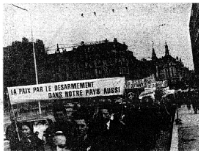
Un nombre impressionnant de jeunes gens et de jeunes filles profondément imprégnés d'un haut idéal de paix et de fraternité.