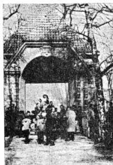
Un groupe jurassien s'est réuni au départ sous la chapelle de Tell, à Montbenon. C'est symbolique!