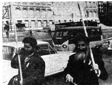
Si l'énorme majorité était des jeunes, il y avait aussi nombre de personnes plus âgées, tel ce pacifiste portant tout simplement un drapeau blanc.