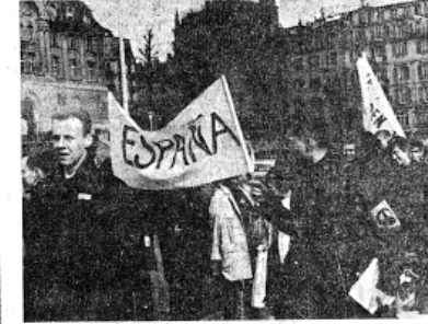
Les travailleurs espagnols, eux aussi, étaient présents. Si dans leur pays, placé sous la botte fasciste, ils n'osent manifester leurs sentiments pacifistes dans notre pays démocratique, ils retrouvent leurs libertés.