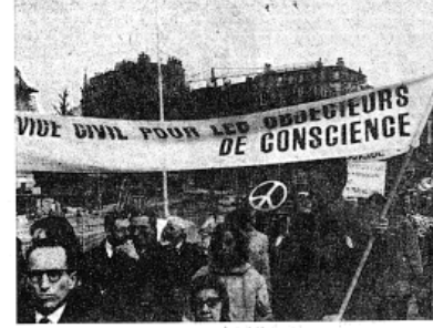
Les jeunes ne pensent pas seulement au terrible danger atomique; ils entendent aussi que l'on rende justice aux objecteurs de conscience.