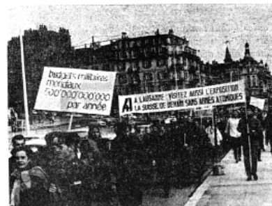
Plusieurs banderoles ont attiré l'attention du public sur