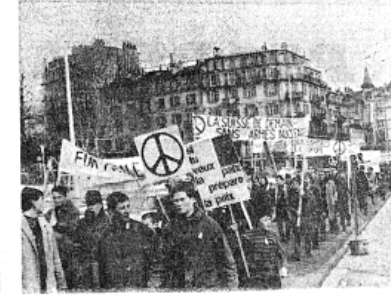
Des jeunes, des très jeunes, en rangs serrés, animés par une vraie soif de paix. C'est un encouragement pour l'avenir.