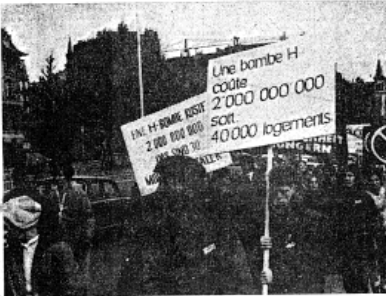
Les pancartes étaient extrêmement nombreuses, et le public fut frappé par le nombre élevé de participants venus de la Suisse allemande.