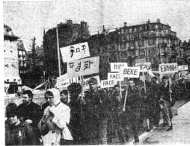
On voit ici le mot « Paix » traduit dans les principales langues.